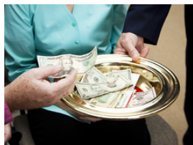
Apoye a St. Jude PNCC

Parroquia San Judas Apóstol de la Iglesia Nacional Católica Polaca "Bajo la protección de Nuestra Señora, caminamos juntos en la fe."